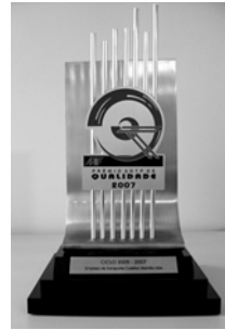
Troféu Prêmio ANTP de Qualidade